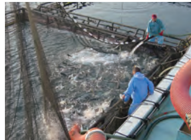
▲養殖ブリの水揚げ（宮崎・黒瀬水産）

漁といっても、遠洋漁業に沿岸漁業。伝統的な帆引き網漁業（茨城県） など、たくさんの種類があるよ。 漁以外にも卵からかえした稚魚を自然にかえす栽培漁業や、養殖とい う方法もあるね。同じ種類のさかなでも「天然」ものと「養殖」もの というちがいがるように、生まれも育ちも様々なんだね。