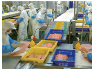
▲サケの加工工場（ニッスイタイランド社）

さかなは使う目的に応じて、加工や調理をされます。 ちくわやフィッシュソーセージ、缶詰や冷凍食品を作る場合は工場へ。 生のさかなの多くはスーパーマーケットなどの小売店へ運ばれるよ。 どういった種類のさかなが、どのように食べられているのだろう？ 加工や調理をする人たちは、みんなが食べやすいようにどんな工夫を しているのだろう？