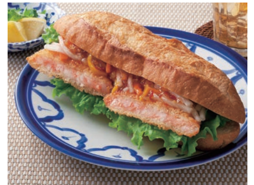
▲エビカツのサンドイッチ

この1週間でどれだけさかなを食べたかな？ それぞれの家庭の味もあれば、「明石ダコ（兵庫県）」など のブランドの魚介類もいるね。「わっぱ煮（新潟県）」と呼 ばれるその地域にしかない郷土料理もあるよ。 給食にもさかなの献立があるし、ファストフードやレストラン のメニューにも色々なさかな料理があるね。 お歳暮に干物を贈ったり、お正月に数の子を食べたりと、 みんなの生活とさかな料理は深く関わっているんだ。