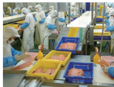
▲サケの加工工場（ニッスイタイランド社）

さかなは使う目的に応じて、加工や調理をされます。 ちくわやフィッシュソーセージ、缶詰や冷凍食品を作る場合は工場へ。 生のさかなの多くはスーパーマーケットなどの小売店へ運ばれるよ。 どういった種類のさかなが、どのように食べられているのだろう？ 加工や調理をする人たちは、みんなが食べやすいようにどんな工夫を しているのだろう？