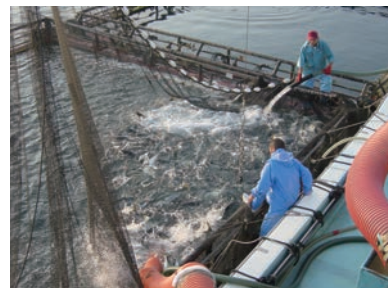
▲養殖ブリの水揚げ（宮崎・黒瀬水産）

漁といっても、遠洋漁業に沿岸漁業。伝統的な帆引き網漁業（茨城県） など、たくさんの種類があるよ。 漁以外にも卵からかえした稚魚を自然にかえす栽培漁業や、養殖とい う方法もあるね。同じ種類のさかなでも「天然」ものと「養殖」もの というちがいがるように、生まれも育ちも様々なんだね。